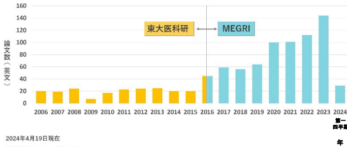
MEGRI 医療ガバナンス研究所 論文数

国内でも、福島県(福島県立医大など)、広島県(エムネス)、鹿児島県(よしのぶクリニック)、福井県(オレンジホームケアクリニック)などの医療機関・研究所と共同研究を進めています。