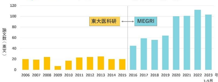
MEGRI 医療ガバナンス研究所 論文数

国内でも、福島県(福島県立医大など)、広島県(エムネス)、鹿児島県(よしのぶクリニック)、福井県(オレンジホームケアクリニック)などの医療機関・研究所と共同研究を進めています。